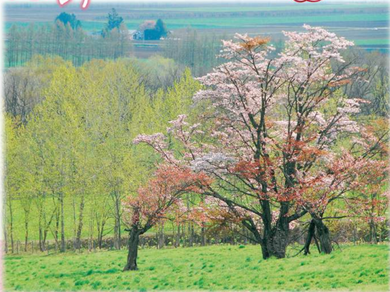
Title/「春の息吹」